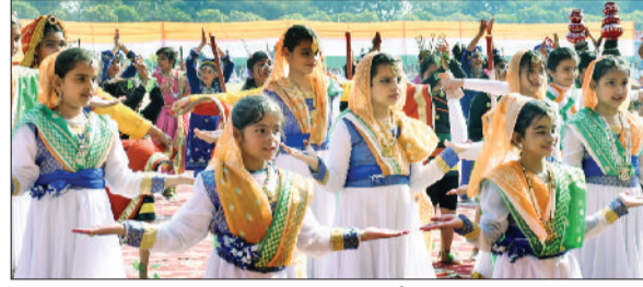
रोहतक। सांस्कृतिक कार्यक्रम प्रस्तुत करते विद्यार्थी।