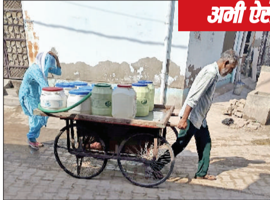
अनी ऐसे हालात ...

शहर की पेयजल व्यवस्था को मजबूत करने की दिशा में एक बड़ी पहल की जा रही है। आंबेडकर पार्क में लगभग एक करोड़ 80 लाख रुपये की लागत से आधुनिक वाटर बूस्टर का निर्माण किया जाएगा। इस परियोजना को मुख्यालय से स्वीकृति मिल चुकी है और जल्द ही इसकी टेंडर प्रक्रिया शुरू की जाएगी। वाटर बूस्टर के निर्माण के बाद आसपास की 10 से अधिक कॉलोनियों में लंबे समय से चली आ रही पानी की समस्या का स्थायी समाधान होने की उम्मीद है। स्थानीय लोगों के अनुसार, इस क्षेत्र में पिछले करीब 30 वर्षों से पेयजल आपूर्ति को लेकर लगातार परेशानी बनी हुई थी। कई कॉलोनियों में कम प्रेशर से पानी पहुंचता था, जबकि ऊपरी इलाकों में तो कई जगह पाइप लाइन ही नहीं है। गर्मियों के मौसम में हालात और बिगड़ जाते थे, जिससे लोगों को निजी टैंकरों पर निर्भर करना पड़ता था। इससे न केवल अतिरिक्त खर्च बढ़ता था, बल्कि रोजमर्रा की जरूरतें भी प्रभावित होती थीं। प्रस्तावित वाटर बूस्टर के निर्माण से जलापूर्ति का दबाव बेहतर होगा और पानी की समान व नियमित आपूर्ति सुनिश्चित की जा सकेगी। अधिकारियों के अनुसार यह बूस्टर आधुनिक तकनीक से लेवल होगा, जिससे कम दबाव वाली लाइनों में भी पर्याप्त पानी पहुंचाया जा सकेगा। इससे आंबेडकर पार्क के आसपास स्थित आवासीय क्षेत्रों के साथ-साथ दूरस्थ कॉलोनियों को भी सीधा लाभ मिलेगा।