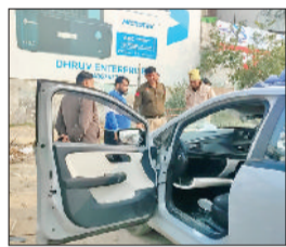
रोहतक। मौके पर जांच करते पुलिस कर्मी।

पुराने आईटीआई मैदान में रात के समय खड़ी गाड़ियों के शीशे तोड़कर चोरी करने की वारदात सामने आई है। इस घटना में तीन नशेड़ियों ने शामिल होने की जानकारी सीसीटीवी फुटेज से मिली है। पीड़ितों ने सुबह जब अपनी गाड़ियों का हाल देखा तो वे सकते में आ गए। उन्होंने तुरंत पुलिस को सूचना दी।